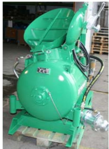
Einwurfseite mit Trichter